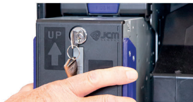
Riciclatore banconote asportabile